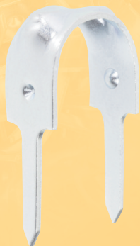
16-2B/16 ES K