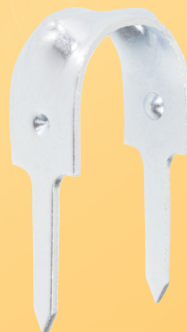
20-2B/20 ES K

Enkelt å sneppe på og slå inn. Eget låsepunkt som holder klammeret fast på røret ved montasje og låser røret i lengderetning etter montasje.